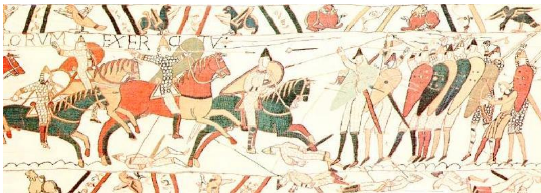
Extraits de la tapisserie de Bayeux, due à la reine Mathilde, épouse de Guillaume le Conquérant.